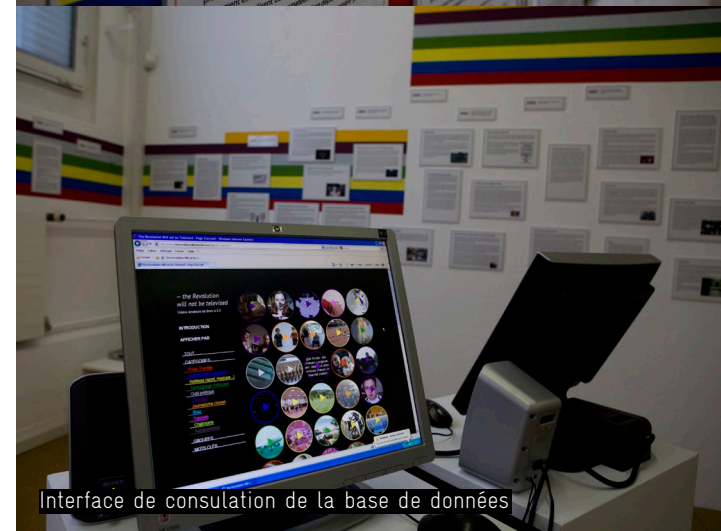
Interface de consultation de la base de données