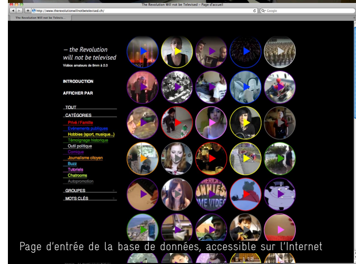
Page d'entrée de la base de données, accessible sur l'Internet